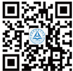
安徽职业技术学院官方微博