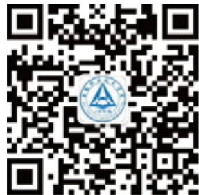
安徽职业技术学院官微